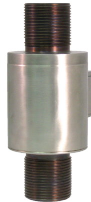
Тензодатчик растяжения/сжатия, модель F2226

Тензодатчик растяжения/сжатия имеет защиту от водяных брызг и отличается надежностью даже при работе в сложных условиях эксплуатации.